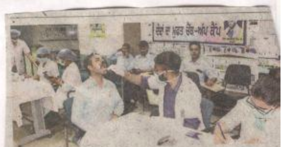
कैंप में मरीजों की जांच करते हुए डाक्टर • जागरण

On first day of camp more than 200 patients were screened and given health education. Free medicines were also provided to them.