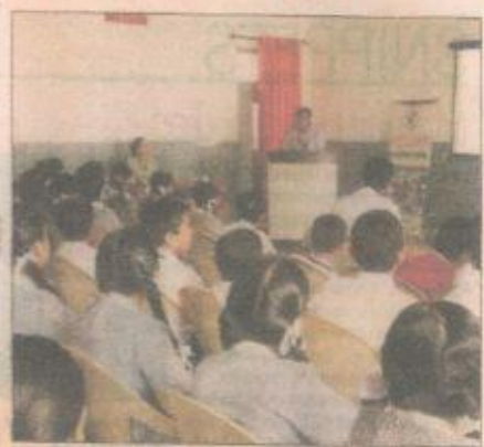
Students of BCM participate in a seminar on oral hygiene in Ludhiana on Sunday.