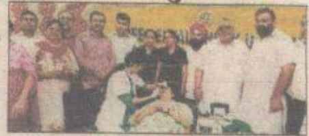
भाजपा महिला मोर्चा द्वारा लगाए मैडीकल कैंप में एक महिला के दांतों की जांच करती डाक्टर।