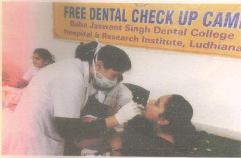
The School for Deaf Children ' 03/09/2016