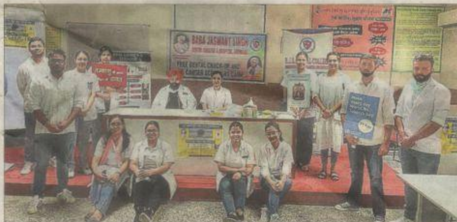
A team of doctors at the dental awareness camp by BJS Dental College and Hospital at Vardhaman Yarn and Thread in Ludhiana on Tuesday.