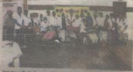
डॉ. नरवीर सिंह के नेतृत्व में 200 लोगों की जांच करवाई गई।