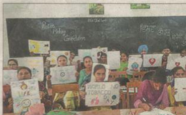
GHG Khalsa College of Education students with posters to mark the day.

gramme under the guidance of Principal Crispin Maria. A special morning assembly was held where students and staff pledged not to smoke and con-