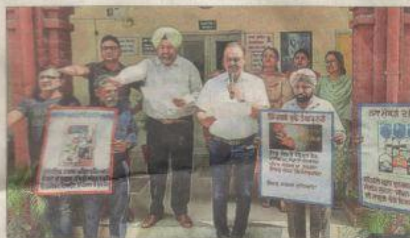
Civil Surgeon office staff holding a rally in Ludhiana

School Tobacco Control Committee of Sacred Heart Convent School, Sector-39, Urban Estate, Chandigarh Road, held a pro-