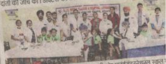
बाबा जसवंत सिंह डेंटल कॉलेज एंड अस्पताल की ओर माउंट इंटरनेशनल स्कूल में लगाए गए कैंप में जांच करवाते हुए विद्यार्थी

से विद्यार्थियों को सेहतमंद शरीर के विकास में दांतों की भूमिका के बारे में बताया गया। उन्हें कहा गया कि दांतों को सुरक्षित रखने के लिए मीठे खाद्य पदार्थों, फास्ट फूड व कोल्ड ड्रिंक से परहेज करें। सुबह और रात को सो से पहले ब्रश जरूर करें। डाक्टरों ने दांतों की नियमित जांच करवाए।